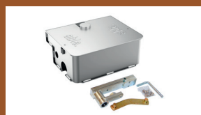
AX UG BOX-IX

Caisson de fondation en acier finition cataphorèse Code A16Y0050