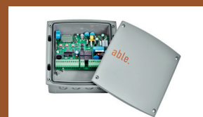
CX FLEXY 433

Armoire de commande numérique universelle pour portails battants ou coulissants - Sortie pour 2 moteurs - 24V Code A12Y0020