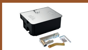
AX UG BOX

Caisson de fondation en acier finition cataphorèse Code A16Y0050